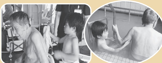
温泉…草津の湯の硫黄の匂い漂う中で ひだまり園児と入浴