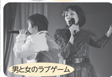
男と女のラブゲーム