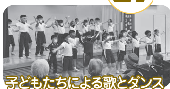
子どもたちによる歌とダンス

10月27日にカーネーションホールにて新見南小学校3年生(26名)と唐松健生会(13名)の方に参加していただき、ふれあい運動会を開催いたしました。赤、青、緑、桃の4チームに分かれて、玉入れと綱引きの2種目で戦いました。どの競技もチーム一丸となり一戦一戦勝利を目指し勝ち抜いた青チームが優勝となりました。秋晴れの日に気持ちの良い汗をかいた一日となりました。