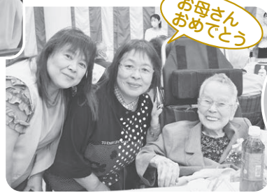
お母さんおめでとう