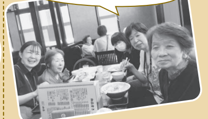
山金ラーメン様、定休日にご対応 ありがとうございました!