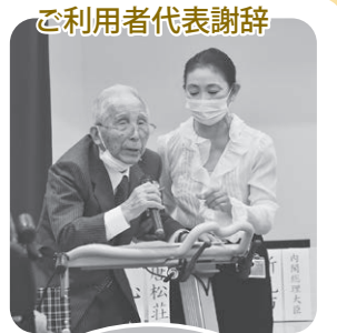
ご利用者代表謝辞