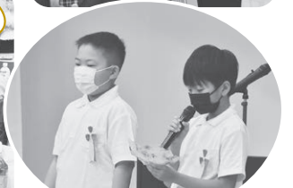
ひだまり園卒園児あいさつ