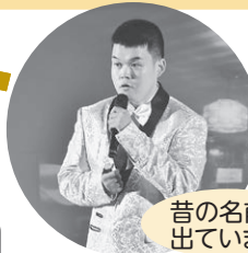
昔の名前で出ています