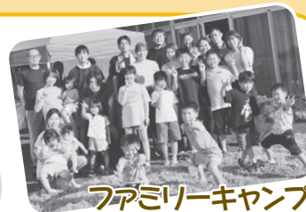
ファミリーキャンプ