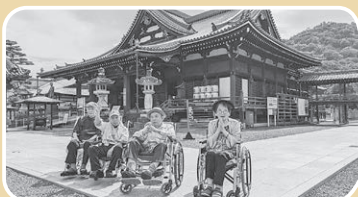
四国旅行…善通寺をバックにパシャリ!